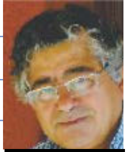
Por: Pepe Mejía, Desde Madrid

Acaba el año 2021 y el continente americano -en donde la pandemia del COVID ha hecho estragos- sigue convulso, inestable. Aumentan las desigualdades y la pobreza; pero en algunos países se encienden luces de esperanza en la perspectiva de un horizonte nada halagüeño para los estratos sociales más precarizados.