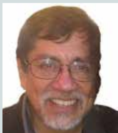
Por Carlos Bernales CABE

millones de contagiados, casi 6 mil muertos en los últimos 28 días sobre 73 mil contagiados en ese mismo periodo.